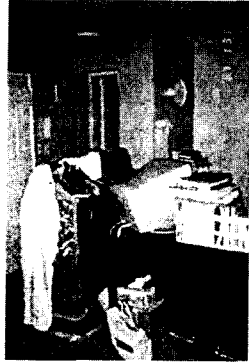
그림 3. 취침공간