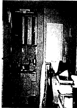
그림 4. 부엌공간

할 수 있도록 수납에서 수평적 공간사용 외에 수직적 공간사용을 가능하게 하는 방안을 모색해야 할 것이다. 이와 더불어, 싱크대부분은 수납문제와 함께 조리를 위한 작업공간 확보문제가 크게 부각되었으며 그로 인해 만족도도 낮게 나타났다. 제한된 규모로 인해 바닥점유면적의 확대가 어려우므로 싱크대 상판의 크기를 사용유무에 따라 확장할 수 있도록 하는 가변형 계획이 필요할 것이다.