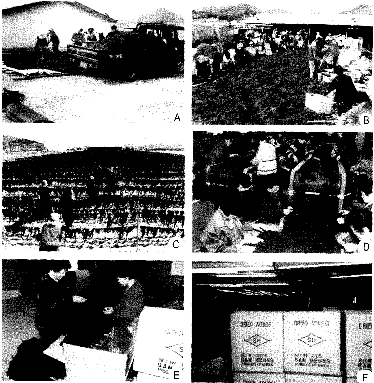
Fig. 2. Procedure of Enteromorpha prolifera processing. A. Transportation of the harvested E. prolifera from cultivation ground; B. Washing of the harvested E. prolifera ; C. Hang out the harvested E. prolifera to dry above the ground; D. Sorting of the dried E. prolifera ; E. Packaging; F. Products.

체의 크기가 1 m 이상 되므로 강한 유속은 엽체 탈락의 우려가 있고, 시설물이 그물망으로 되어있어 쉽게 파괴될 수 있다. 따라서 양식장은 조류 또는 유속이 느린 내만 해역, 즉 10~20 cm/sec의 해역이 적합하였다. 가시파래의 엽체가 표층 노출식으로 양식되고 있어 적절한 파랑은 산소와 이산화탄소 공급을 원활하게 할 뿐만 아니라 영양염 공급을 양호하게 하여 성장을 촉진시킨다. 그러나 강풍은 높은 파랑을 일으켜 엽체의 탈락과 시설물이 파괴될 수 있다. 가시파래의 양식은 동계에 실행하므로 북서풍이 약한 지역을 택하여야 한다. 엽체의 생장은 빠르고 대