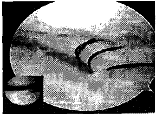
Fig. 2. Four No.1 PDS vertical enclosing sutures of the lateral meniscus of a 31 year old male are completed (Inset: Preoperative vertical longitudinal tear of anterior half of lateral meniscus).

합사는 No. 1 PDS, No. 1 Maxon, No. 2 Ethibond 를 한가지 또는 혼합하여 사용한다. 18 게이지 바늘 두 개와 suture retriever 또는 graspe를 준비한다.