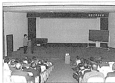
지난 2월 6일, 세미나 광경

지난 1999년 폐지됐던 건축사업무대가기준이 부활할 전망이다. 우리협회는 지난해 개정된 건축사법에서 건축사의 업무범위와 대가기준을 건교부장관이 공고할 수 있다는 근거조항이 마련됨에 따라 지난해 대한건축학회에 발주한 대가기준 연구용역을 완료, 지난 2월 6일(수) 협회 강당에서 전문가 세미나를