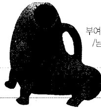
부여군수리 절터에서 발굴된 변기 /남성용

화장실의 원리를 이용했다. 이 양식은 그 후 일본에도 전해져서 '가와야(川屋)'라는 이름으로 널리 응용되었다. 칩칭은 일종의 수세식 변소라 할 수 있는데 수세식은 하수도 시설이 발달한 유럽이나 동양 또는 물이 많은 남방(南方)에서 발달했던 형식이다. 일찍이 분노를 비료로 사용했던 농경 문화권의 한국에서는 일부 강변 마을에서 일시적으로 시험했던 양식으로 생각된다.