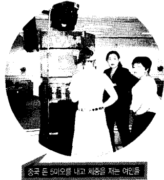
중국 돈 5마오를 내고 체중을 재는 여인들

변화의 속도가 빠른 중국인데도 화장실 시설 개선에 대해서는 무심하다. 연태항은 국제항인데도 그렇다. 소변을 보고 사진을 몇장 찍었다. 공안원의 모습이 보이질 않았기 때문이다. 사진에서 보다시피 시설은 황망그레하다. 하지만 제작년에 비해 청소는 열심히 한 흔적이 보인다. 시설은 형편없지만, 많이 깨끗해졌다. 그나마 다행이라면 다행이다. 이번에는 연태버스터미널에 가보았다. 연태버스터미널에는 산동성의 성도인 제남이나 해수욕장으로 유명한 청도시로 가는 버스가 많다. 대합실에 들어가니 재밌는 장사가 하나 눈에 띈다. 중국돈 5마오(80원)를 받고 체중을 재어주는 장사이다. 마침 중국 아가씨가 체중을 재고 있다. 사진을 찰칵 찍었다.