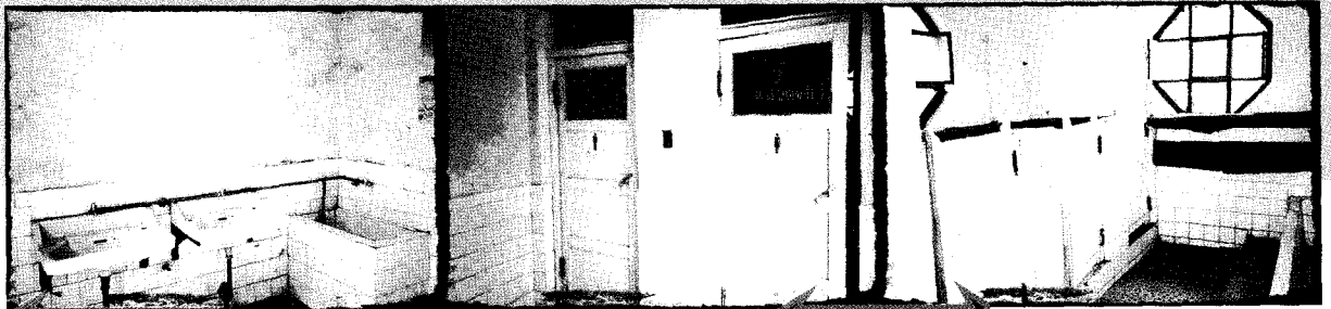
연태시 복건성박물관 화장실 세면대