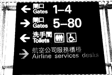
▶ 홍콩공항의 화장실 표시사인