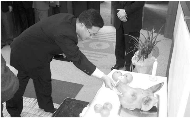
▲ 협회 이전 고사 모습

고사에서 이석영 중기청장은 협회가 기술센터에 새 등지를 틀어 새로운 마음으로 벤처기업의 새출발에 일임해 줄 것을 당부했다.