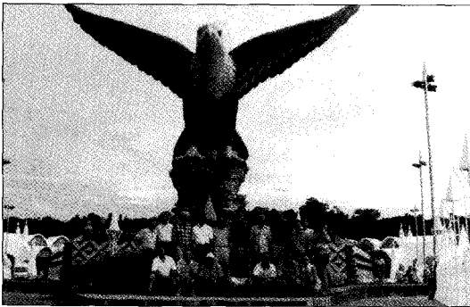
랑카위섬의 상징인 벽돌색독수리상 앞에서

또한 일정을 마치고 29일에는 랑카위섬 관광을 하였다. 랑카위는 현 말레이시아 마하티르 수상의 고향이며, 말레이시아 정부차원에서 관광지로 발전시키고자 노력하는 섬으로 깨끗한 인도양 위에 좋은 관광지였지만, 필자는 개인적으로 우리나라 제주도가 훨씬 풍광이나 관광지, 숙박시설들이 훌륭하게 갖추어져 있다는 생각이 들었다.