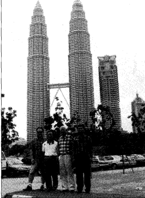
말레이시아 쿠말라룸프르의 상징인 KLCC타워 앞에서