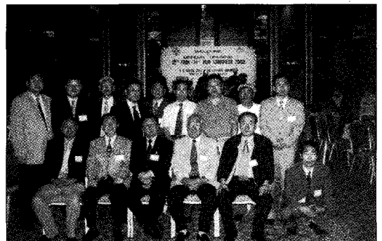
제13차 FAVA Congress 개막식에 참석한 우리회 회원