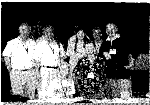
학회장에서 만난 지인들, 호주, 영국 교수들