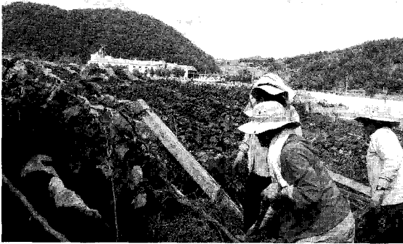
▲ 수마가 힘퀴고 간 자리. 충북 영동지역 포도밭도 이번 태풍으로 초토화 됐다.

농경지 복구비 경우 3ha미만농가는 복구비의 60%가 지원되고, 3ha이상농가는 40%만 지원되어 정부시책에 따라 규모화영농을 시행한 농가가 오히려 보상을 적게 받는 불이익을 받고 있다. 비닐하우스 복구비의 경우에도 20%만 지원되고, 대