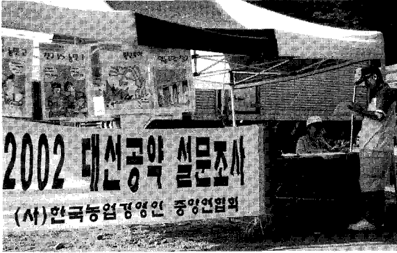
▲ 지난 2001년 각도 농업경영인 대회에서 대선공약에 대한 설문조사를 실시하였다.