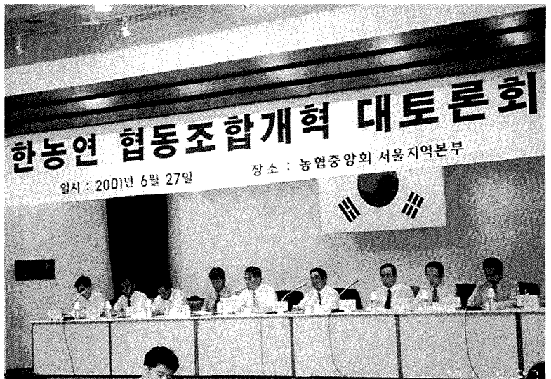
▲ 지난 6월 27일 한농연중앙연합회에서 개최한 협동조합개혁 대토론회.

따라서, 금융연구원의 보고서는 신용사업 중심의 시각으로 협동조합이 가진 고유의 목적보다는