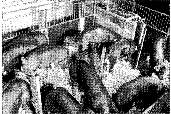
▲2002년 돼지고기 국내 총 공급량은 884,012톤으로서 이중 생산량은 790,342톤, 수입량은 65,635톤으로 전망된다.