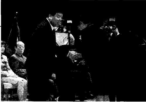
▲ 발표자로 선정된 5명의 여성 발명인들에게는 '우수 여성발명인패'가 수여됐다.