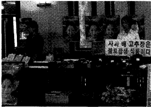
▲ 선정된 발표자들의 발명품들이 한 곳에 전시되어 이날 발표회에 참여한 모든 이들에게 흥미의 대상이 되었다.