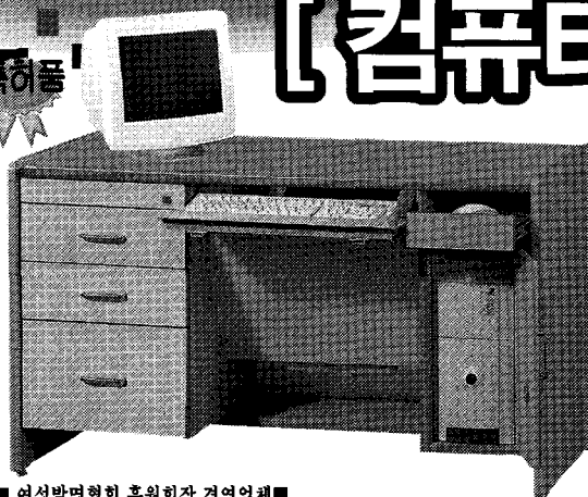
■ 여성발명협회 후원회장 경영업체 ■

에리트 퍼니처는 80여개의 지적 소유권을 보유, 앞선 기술력으로 가구의 과학화를 이룩하고 21세기 지식 정보화시대 구현을 위하여 앞장서 뛰고 있습니다.