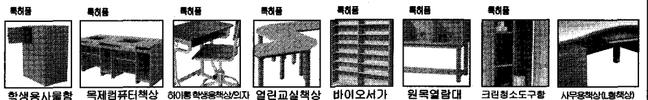
학생용사물함, 목재컴퓨터책상, 하이톤학생용책상이자, 얼린교실책상, 바이오서가, 원목일람대, 크린형소도구함, 사무용책상(원목책상)