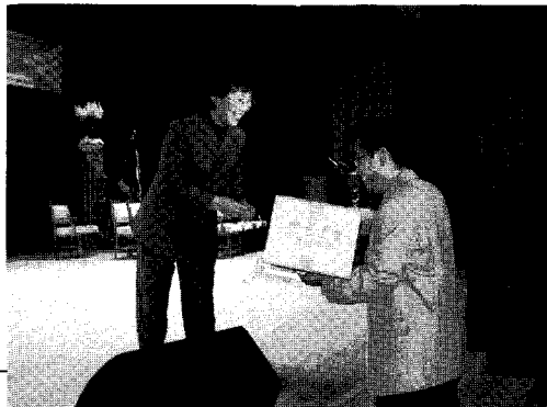
▲ 이날 행사에서는 40여명의 참석자들이 여러 업체에서 제공한 크고 작은 경품들의 주인이 되었다.