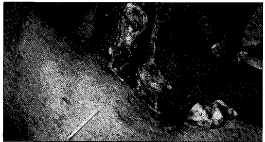
▲ 자궁경관 개장부전으로 태아가 폐사되어 모체내에서 부패되어 제왕절개로 태아를 적출하는 장면

배출시킨다. 만일 산도 협착으로 태아 배출이 불가능할 경우에는 개복수술을 하여 어미와 태아를 살릴 수 있도록 조치하여야 한다.