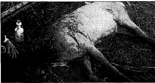
▲ 발정기시 숫사슴의 공격으로 늑골이 골절, 농양을 제거하는 모습

치료 : 비타민, 메치오닌 등 강간제와 이담제, 항생제 등과 포도당 등 영양 수액을 주사한다.