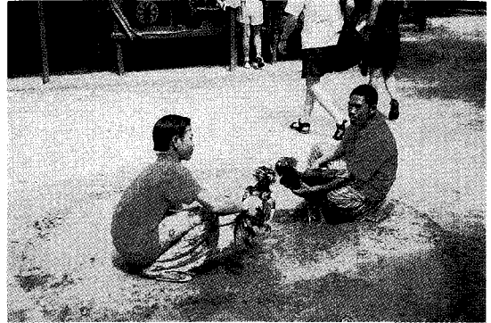
▲ 해안가에서의 닭싸움 장면(인도네시아의 닭싸움은 세계적으로 유명하며, 전국 어디서나 쉽게 접할 수 있다.)

국민총생산의 25%를 차지하나 노동력의 50%가 농업에 종사한다. 방문 당시 1달리가 8,500Rupiah의 환율이 적용되고 있었는데, 발리인들의 월수입은 한화로 환산하여 경력이 많은 공무원이 대략 20만원 정도인데, 나머지는 10만원선대의 생활 수준을 보이고 있다.