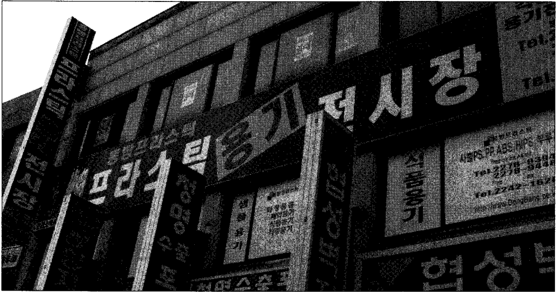
▲ 을지로 방산시장 내에 위치한 동방프라스틱 용기전시장

문에 품목 관리가 쉽지 않고 자주 금형을 교체해야 하는 어려움이 생긴다. “십여 만개를 주문하는 고객도 중요하지만 비록 소량의 구매자들이지만 동방의 제품을 쓰는 이상 최고의 고객으로 생각한다”며 “저희와 같은 제조업체는 회사의 성장이 거래선에 의해 큰 영향을 받습니다. 때문에 일반 대량 구매선 만을 믿고 운영하다가 최악의 경우 거래업체가 부도를 맞게 된다면 동방 또한 회생 가능성이 희박할 것입니다”라고 말하는 동방은 여러 고객선을 확보하고 있어 안전 거래를 실행하고 있다고 자신 있게 설명했다.