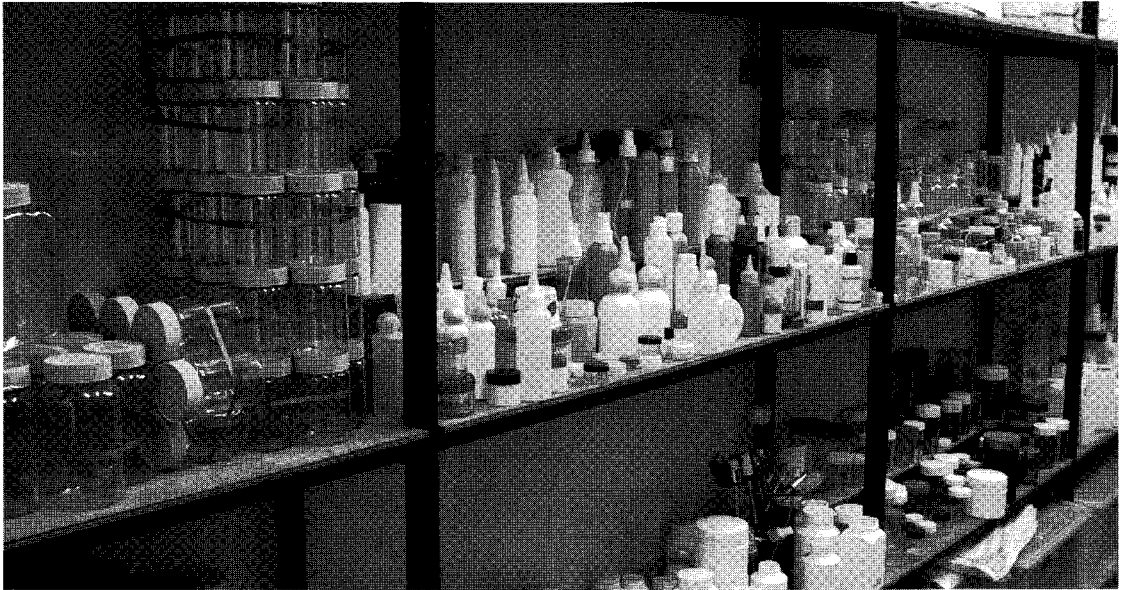
▲ 전시장 내 비치된 동방의 각종 제품들