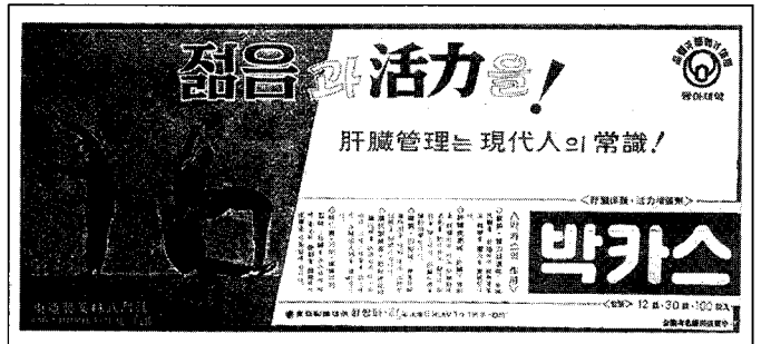
▲ 1962년 동아일보에 게재된 박카스 광고

박카스내복액은 맛도 호감을 주었고 소비성향도 맞았기 때문에 유리한 여건이 조성되었으나,