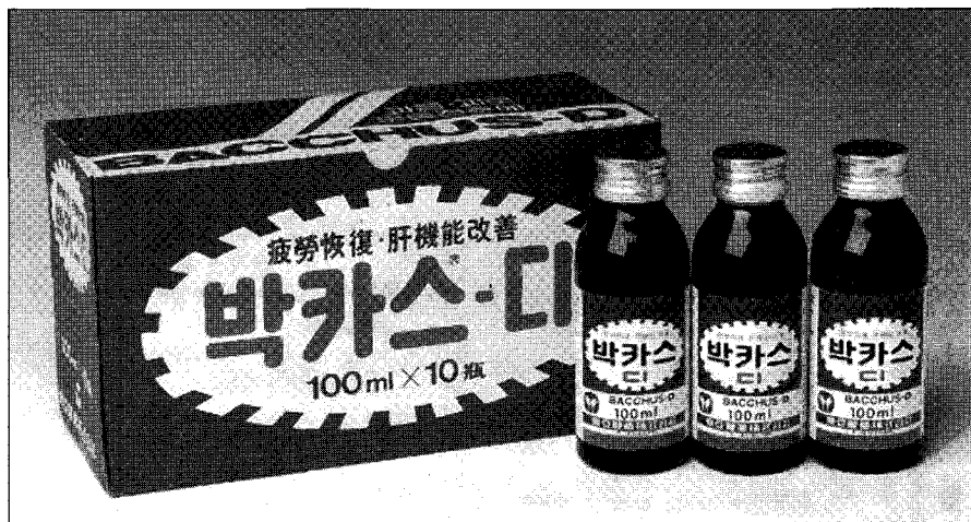
◀ 드링크 타입(Type)으로 대체된 박카스-디

1982년 해외 신문광고는 박카스가 '이민 생활의 좋은 벗'이라는 점을 강조, 오순택 교포 테니