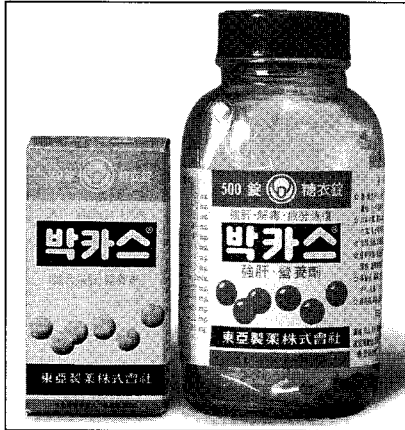
▲ 처음 발매된 정 타입(Type)의 박카스