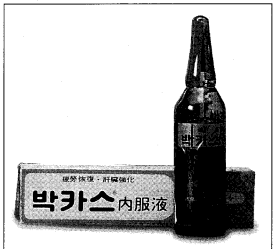
▲ 마시는 앰플 타입(Type)의 박카스

시간이 갈수록 앰플 용기의 문제점이 더욱 두드러지게 나타나면서 새로운 용기에 대한 검토가 시작되었다.