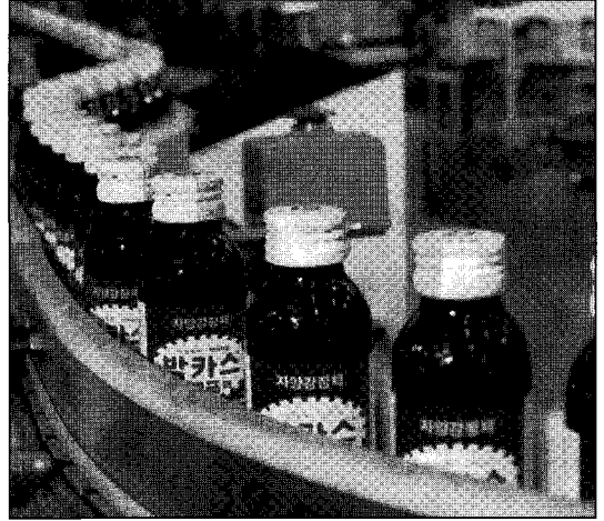
▲ 현재 발매 중인 박카스-에프 생산라인

스 선수가 오른손에는 라켓, 왼손에는 박카스를 들고 물끄러미 보고 있는 광고카피를 내세워 해외 교포들의 향수를 자극해 성공을 거두게 된다.