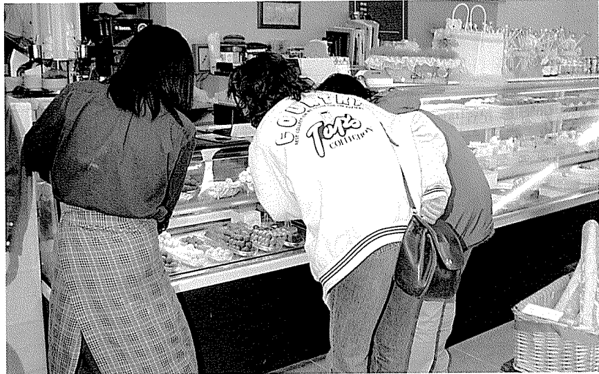
▲ 양과자 제품에 대한 고객들의 관심이 최근 들어 부쩍 증가하고 있다는 것을 여러 경로에서 감지할 수 있다. 사진은 서울의 한 여대 앞에 있는 베이커리에서 소비자들이 무스케이크를 고르고 있는 모습.

냉동튀레시장에 후발 주자로 시장에 진입한 한국하인즈는 망고, 블랙커런트 등 냉동튀레 5종과 냉동과일 3종 등을 수입해 판매하고 있다. 업체 관계자는 “프랑스 폰티에르(Pontier)사의 제품을 수입하고 있으며 인공색소, 보존료, 물 등이 전혀 가미되지 않은 순수 자연식품”이라고 강조했다.