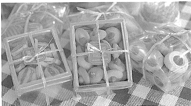
▲ HBM 생약 성분을 활용해 만든 각종 쿠키류, 모닝빵과 식빵, 쿠키류 등 각종 제품에 응용이 가능하다.

■ HBM(한방 생약 신소재) 문의 : 용성복 사장 ☎ 011-875-6599