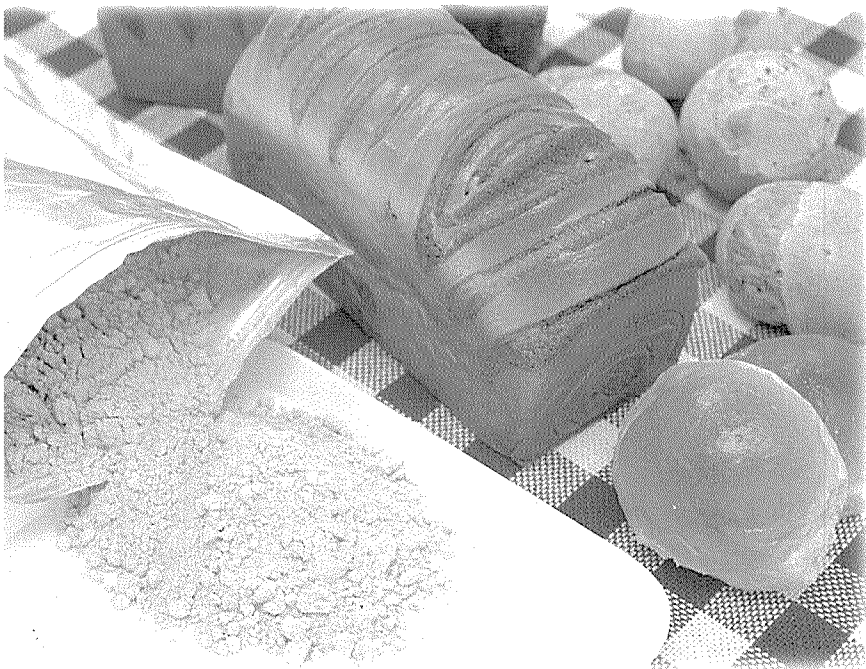
▲ HBM 생약과 이를 활용해 만든 식빵. 일반 식빵보다 검은 빛이 도는 것이 특징이다.

효과가 있는 것이 가장 큰 특징이다. 특히 비만을 불러오는 체지방을 제거하며 무리한 식이요법으로 인한 부작용이 없다는 점에서 좋은 반응을 얻고 있다는 설명이다.