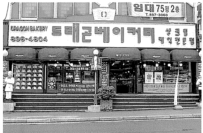
▲ 6개월의 임상 실험과 시식회를 통해 한방다이어트 빵을 개발한 드래곤베이커리.

이번 신제품은 천연 한방제품이 포함돼 굵지 않고 아침과 저녁식사 대응으로 약간의 식이요법만 병행하면 한달 후 전체 체중의 5% 감량