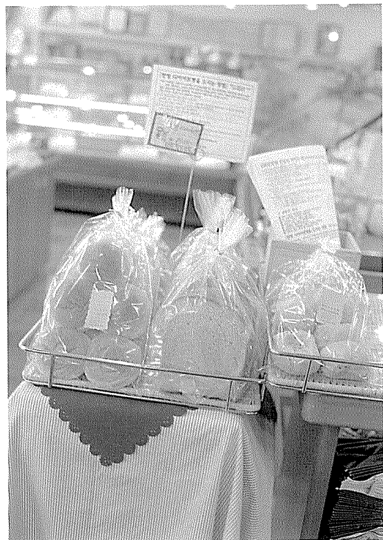
▲ 드래곤베이커리에서는 한방 기능성 다이어트 빵을 판매하는 코너를 따로 마련해 시판하고 있으며 설명서도 함께 부착하고 있다.