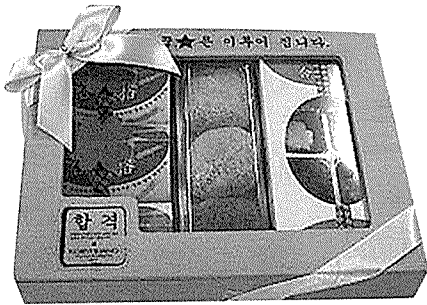
▲ '꿈은 이루어진다' 세트 : 1만 2,000원 ● 3색 떡 + 초콜릿 + 엿