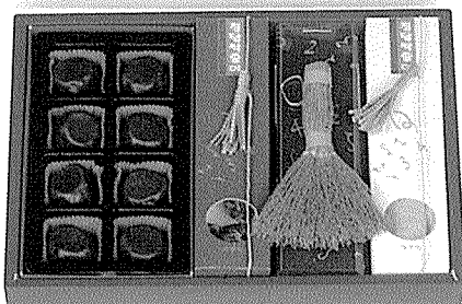
▲ '정답 싹 쓸어' 세트 : 1만 5,000원 ● 초콜릿 + 사탕 + 엿 + 빗자루 미니어처