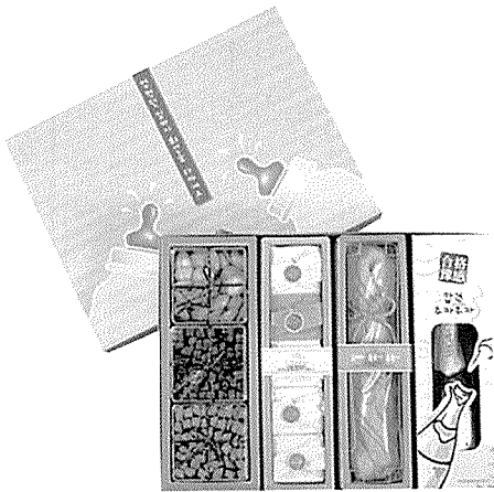
▲ '수능 실타래' 세트 : 3만원

올해 각 업체들이 준비한 수능 선물세트의 가장 큰 특징은 단연 초콜릿 제품의 눈에 띄는 증가세다. '엿'에 대한 선호도가 급감하고, '초콜릿'이 상시 선물용 상품으로 각광받고 있는 현실을 반영한 것. 또한 '꿈은 이루어진다'에서 '가세 가세 대학가세'까지 각사마다 독특한 제품 컨셉을 정해 개성을 담아낸 제품이 주를 이룬다.