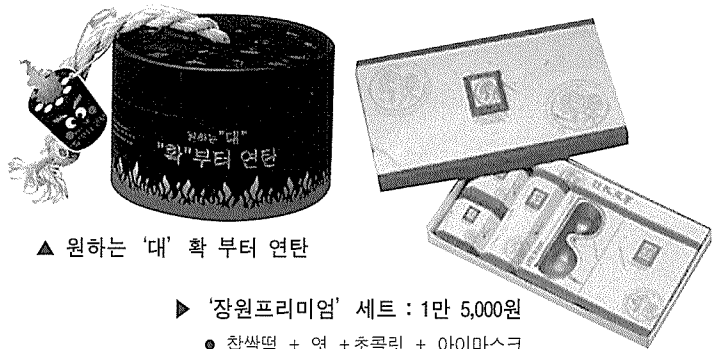
▲ 원하는 '대' 확 부터 연탄

제품+모래시계 : 합격하시게 / 금박 몰딩 초콜릿 돼지 : 합격돼야지 확 부터 번개탄·연탄 / 다이어마이트 : 합격 폭탄 / 초강력 엿 '따악폴'