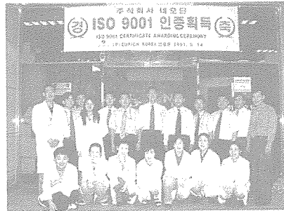
ISO 9001 인증 획득 기념으로 연구원들이 함께 찍은 사진

이 부족한 우리 경제가 에너지 저소비형 산업구조로 전환하는데 아주 적합한 산업으로 각광받고 있다. 특히 생명공학 분야는 인간 유전체 구조가 밝혀져 질병의 진단과 치료 또는 예방에 엄청난 변화를 가져올 것이며 이에 따른 기술개발, 생산 및 유통 등 모든 분야에 새로운 산업으로 급부상하고 있는 산업이다.