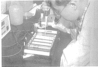
연구하고 있는 모습

현재 바이오산업은 환경 친화적, 자원 및 에너지 절약형 산업, 고부가가치를 창출하는 미래 산업으로서 자원