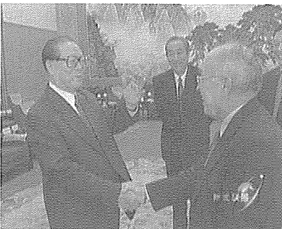
ICM 2002에 대한 정부의 지원을 강조하는 장쩌민주석

을 끈 행사중의 하나는 프린스턴대학 수학과 교수 John Nash의 강연이었다. 그는 1994년 노벨 경제학상을 받은 수학자로 세인에게는 아카데미상을 받아 유명한 영화 "A Beautiful Mind"의 주인공으로 잘 알려져 있다. 그는 게임이론에 관하여 강연을 하였는데 강연이 끝난 후 사람들이 꽃다발을 주려 하였으나 어쩐지 뒤돌아서며 받지 않아 그의 아내가 대신 받는 일화도 있었다.