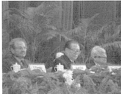
ICM 2002 개최식 - 중국 인민궁전

올해의 필즈메달은 Institut des Hautes Etudes Scientifiques (IHES) 소속의 프랑스 수학자 Laurent Lafforgue 교수와 미국 Institute for Advanced Study in Princeton 소속의 러시아인 수학자 Vladimir Voevodsky 교수에게 안겨졌다. 필즈메달은 수학의 노벨상이며, 1931년 처음으로 상의 제정을 결정한 준비위원회 위원장이었던 캐나다 수학자 John Charles Fields(1863~1932년)의 이름을 따서 붙여졌다. 공