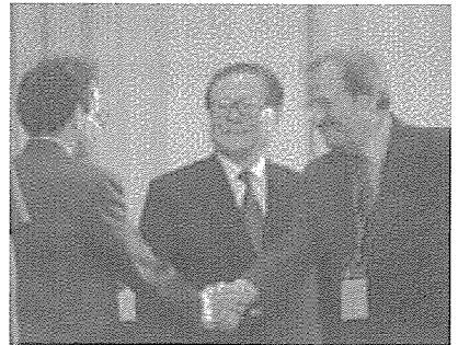
2002 필즈메달과 네반리나상 수여식

세계수학연맹은 회원국 각 나라를 수학의 수준, 능력, 그리고 규모에 따라 5등급으로 분류하여 5등급에 속한 국가에는 5명의 선거권이 주어지고 2등급 국가에는 2명의 선거권이 주어지는 형식으로 총회 대의원을 초청한다. 우리나라는 아직 2등급이고 중국은 미국 등지에서 활약하고 있는 수학자들의 활동에 힘입어 중국 본토는 3등급, 대만 2등급, 그리고 홍콩은 1등급이다. 우리 대한수학회도 승급을 위해 노력하고 있다. 등급이 높을수록 대의원 수가 많아 영향력을 크게 행사할 수 있다. 이런 국제행사가 열리면 해당 국가의 수학자들과 수학을 공부하는 학생들은 유명한 수학자들을 직접 대면하고 대화를 나눌 수 있는 기회가 많이 주어져 더 많은 영감을 받고 또한 수학 발전에도 크게 도움이 된다.