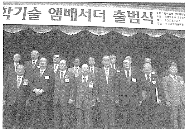
위촉된 과학기술 앰배서더 대표와 출범식에 참석한 각계 인사

과학기술부와 한국과학문화재단은 청소년에게 과학기술에 대한 올바른 인식을 심어주고 과학기술계로의 진출을 확대하기 위해 전·현직 과학기술인 4백30명을 과학기술 앰배서더로 모집, 위촉하고 10월 8일(화) 오후 6시 한국과학기술회관 지하 1층 대강당에서 과학기술 홍보대사의 역할 및 결의를 다지는 출범식을 거행했다. 이번 선정된 과학기술 앰배서더는 대학, 연구기관, 산업체 등 사회 각 분야에서 중견급 이상 재직하거나 재직했던 과학기술인으로 과학 분야에 탁월한 공로와 성과를 인정받