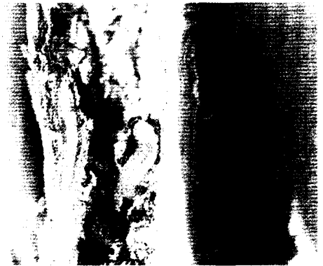
▲ 솔애기잎말이 나방 유충 피해(소나무)