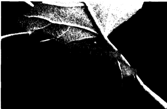
▲ 뱀눈박각시 유충