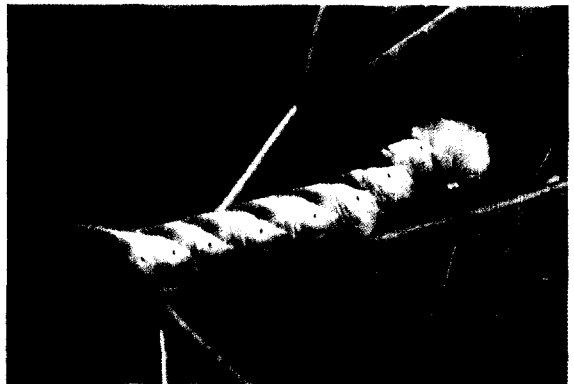
▲ 큰쥐박각시 유충

여 1화기 성충은 5월, 2화기 성충은 7~8월에 우화하고 유충은 6~10월에 나타난다.