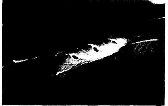
▲ 녹색박각시 유충