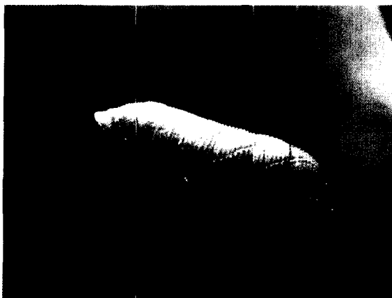
▲ 분홍등줄박각시 유충