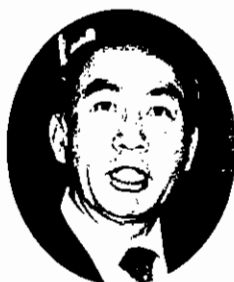
손길승 SK그룹 회장

먼저 한국대학교육협의회가 창립 20주년을 맞이한 것을 진심으로 축하드립니다.