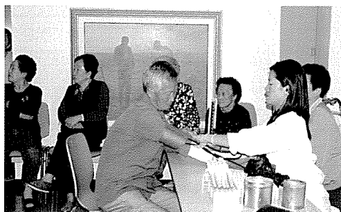
▲ 제주지부는 제주시보건소, 노인복지시설인 평화의 집 등 기초생활보장수급권자, 원생 60여명에게 무료건강검진을 실시했다.