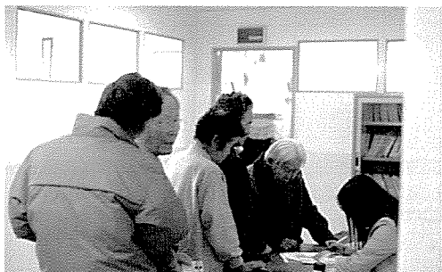
▲ 울산지부는 노인복지시설인 남구노인복지회관, 월마트, 평화선교원 외 10개처 등 노인 및 원생, 일반 시민 560여명에게 무료건강검진을 실시했다.