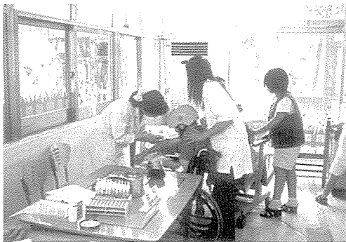
▲ 경기도지부는 엘리엘동산에서 장애인 50여명에게 무료건강검진을 실시했다.