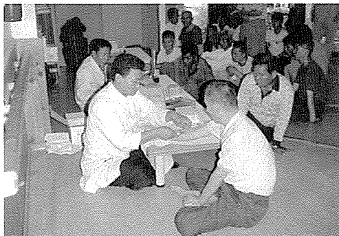
▲ 전라북도지부는 작은샘골 사랑의 집에서 무의탁중증장애인 100여명에게 무료건강검진을 실시했다.