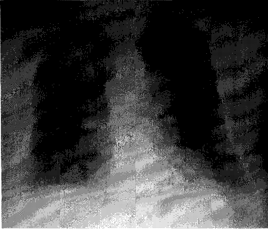
Fig. 1. Initial chest X-ray film shows increased opacity in the right upper and lower lung fields and the left lower lung field.

병원 경유하여 정오경 본원 응급실로 전원되었다. 진찰 소견 : 내원 당시 혈압은 74/50 mmHg, 호흡수는 분당 20 회, 맥박은 분당 123 회, 체온은 34°C 였다. 의식은 명료하였고 급성 병색을 보였으며, 흉부 청진 상 호흡음은 거칠고 우측 폐야에 흡기시 천명음과 수포음이 들렸다. 심음은 규칙적이었으며 심 잡음은 없었다. 복부는 팽만하였고 장음은 정상이었으며 촉진 상 압통은 없었다. 간이나 비장은 촉진되지 않았다.