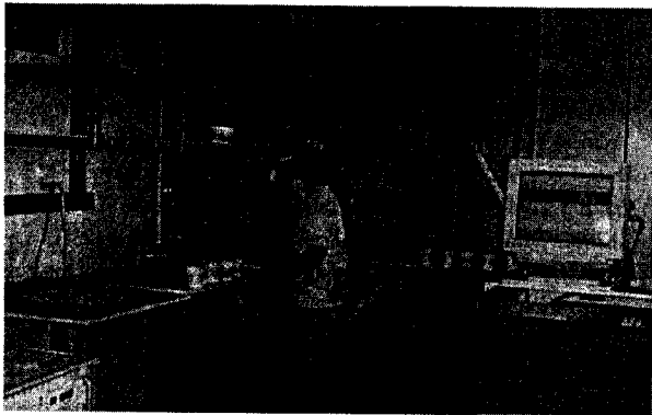
그림 2. 사용성 실험 과정.

종래의 ‘ㄱ’ 자형 싱크대의 긴쪽의 중앙에 위치한 개수대를 ‘ㄱ’자 부분의 코너에 위치함으로써 전체의 동선을 감소하였다. 개선의 효과를 확인하기 위하여 From to Chart의 개념을 이용하여 각 작업영역 사이의 거리를 작업영역 사이의 사용빈도와 곱하여 전체 동선거리를 계산한 결과 아파트별로 적게는 1.3%에서 많게는 9.7%, 평균적으로 5.5% 정도의 이동거리가 감소되는 효과를 가져오는 것으로 나타났다. 이러한 거리를 주부들이 평생동안 주방 내에서 이동하는 거리를 고려하면 그 이동거리의 감소효과는 더욱 크게 될 것이다. 조사대상이 되었던 아파트별 개선 전과 후의 이동거리의 감소효과에 대한 결과가 <표 6>에 나타나 있다. 아파트 간의 이동거리의 차이는 주부들의 가사활동량의 차이에서 기인한다.