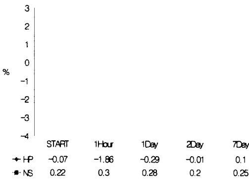
Fig. 3. CT changes in HP&NS group CT: Compared Temperature HP: Hominis Placenta NS: Normal Saline