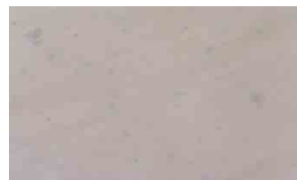
Test group 1-TC-HCl 50mg/ml