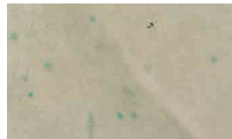
Test group 3-TC-HCl 250mg/ml