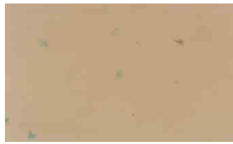
Control group-S & RP