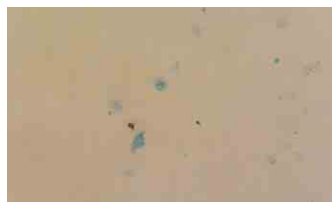
Control group-S & RP