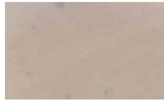
Test group 1-TC-HCl 50mg/ml