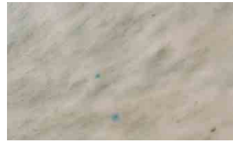
Test group 3-TC-HCl 250mg/ml