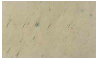
Test group 2-TC-HCl 125mg/ml