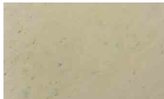
Test group 2-TC-HCl 125mg/ml