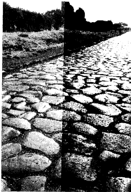
지금까지도 보존상태가 양호한 로마 가도

로마 제국이 오랫동안 '팍스 로마나' (로마에 의한 평화)를 유지할 수 있었던 것은 로마 제국 방위선 바깥에 사는 사람들(로마인들은 이들을 '바르바리'라고 불렀다)이 쳐들어오지 못하게 막는 데 그치지 않고 이들이 로마 제국 주민들과 평화롭게 교역을 함으로써 싸움 일이 없게끔 만들었기 때문이다. 이를 위해서는 국경을 개방하고 속주는 물론 야만족이 사는 곳까지 차별하지 않고 도로와 수로, 교량을 건설하여 지역경제를 활성화하고 생활 수준을 높이려고 노력하였다. 더욱이 로마의 세계는 소득에 대한 일정 비율로 거두었으므로 경제가 활성화하면 속주세도