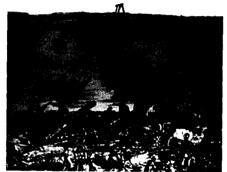
다키아 전쟁 때 다뉴브 강에 부교를 건설하고 있는 로마 병사들

당시 SOC 건설의 재원은 다키아 전쟁의 전리품으로 충당할 수 있었다고 하지만, 대규모 공공사업이 큰 차질없이 수행될 수 있었던 것은 로마 군대의 총사령관을 겸하였던 트라야누스 황제가 군사작전식으로 건설공정을 관리하였기 때문이라고 전해지고 있다. 물론 로마식 조형미를 유감없이 발휘한 다마스쿠스 출신의 천재적 엔지니어 아폴로도로스의 도움도 말할 나위없이 컸다. 그러나 서기 107년부터 112년에 걸쳐(공사에 사용된 벽돌의 제조연도에서 확인) 수도 로마와 본국 이탈리아뿐만 아니라 제국 전역에 걸쳐 벌였던 공공사업이 성공적으로 수행될 수 있었던 것은 공사를 발주한 기관이나 건설업자가