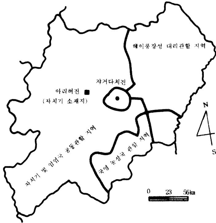
그림 4. 현재 어룬춘자치기의 관할 구역 편성

속되지 않고 있다. '정기합일(政企合一)'에서 '정(政)'은 헤이룽장성이 '기(企)'는 중앙정부 임업부가 각각 맡고 있다.