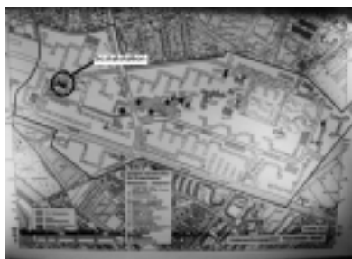
그림 2. 지역보건지원소와 타 재가복지시설의 배치도