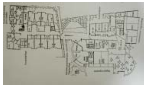
그림 1. 평면도

노인을 위한 모든 재가의료보건복지시설들을 통합하여 하나의 콤플렉스로 계획된 Viernheim의 노인종합복지회관에 계획된 지역보건지원소이다.