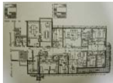
그림 4. 평면도