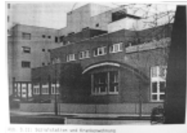
그림 3. 지역보건지원소의 정면