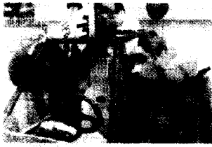
◀ 자작자동차 경주대회 출전 차량을 점검하는 모습