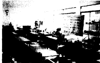
▲ 전기전자 실습실