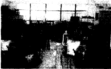
▲ 기관 실습실