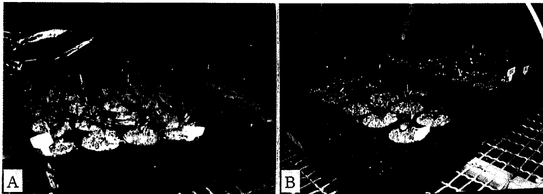
Fig. 3. Effects of compost on hardening of Calanthe discolor Lindle plantlets.