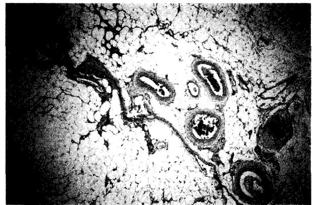
Fig 2. Mammary tumors was diagnosed lipoma in histologic examination(H-E stain, ×100)