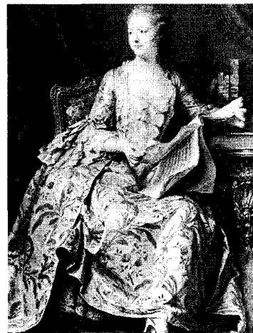
<그림 10> 깊게 파인 네크라인의 여성복식 정홍숙, 『서양복식문화사』, p.238.

이 당시 여왕과 살롱의 부인들에 의하여 유행이 주도되었는데 가슴을 깊이 파고 허리는 졸라매고 험 부분을 펼침으로써 여성적인 곡선미를 의식적으로 강조하였다<그림 9>, <그림 10>. 78)