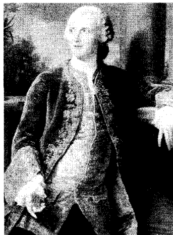
<그림 12> 18세기 남성복식의 모습 『20,000 Years of Fashion』