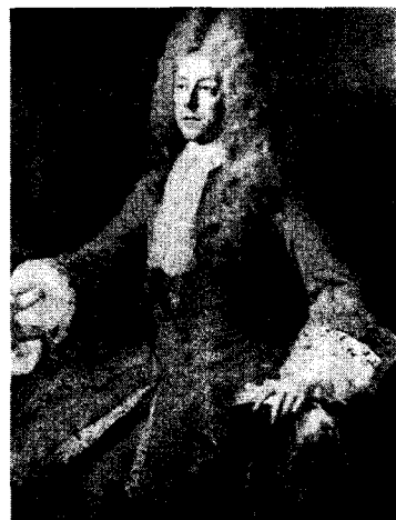
<그림 7> 여성적인 실루엣의 쥐스토코르 『20,000 years of Fashion』

남성의 헤어 스타일에도 변화가 생기기 시작하였다. 17세기 후반기에는 남성들의 머리가 길어지고 웨이브를 하게 되었다. 이후 좀더 아름답게 표현하기 위한 방법으로 가발을 사용하였는데 복식 사상 이와 같이 여성스러운 머리를 한 것은 이때가 처음이었다<그림 8>. 75)