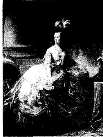
<그림 9> 노출된 목선과 가는 허리로 여성성을 강조한 의상, 정홍숙, 『서양복식문화사』, p.238.