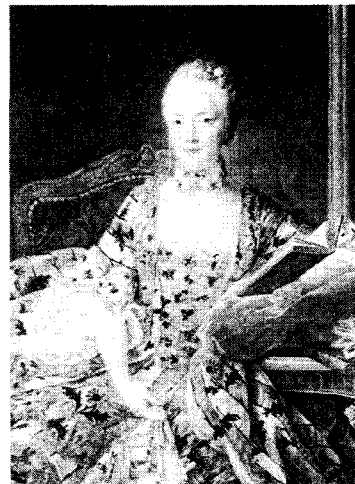
<그림 5> 18세기 화려했던 여성의 복식 정홍숙, 「서양복식문화사」, p.244.

특히 리본으로 화려하게 장식된 스토머커가 있는 것이 특징이며 꽃, 리본, 조화, 꽃 모양의 루프, 웰팅, 트리밍, 플라운스, 진주, 자수 등으로 목둘레나 스커트 가장자리를 장식함으로써 의상 자체를 하나의 장식 미술로 취급하였다<그림 5, 6>. 62)