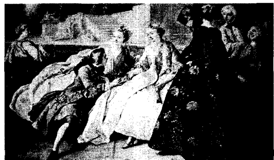
<그림 2> 살롱에서의 남성과 여성의 모습 정홍숙, 「서양복식문화사」, p.245.

18세기에 이르러 전통과 권위보다는 진보를 선호하는 새로운 인문주의가 등장하였다. 전통 귀족은 물론 여러 범주의 부르주아가 지적 삶에 참여하였으며 여자들도 점점 더 중요한 기능을 수행하였다. 이제 궁정은 더 이상 주목을 받지 못하게 되었고 살롱이 더 큰 역할을 맡게 되었다. 30)