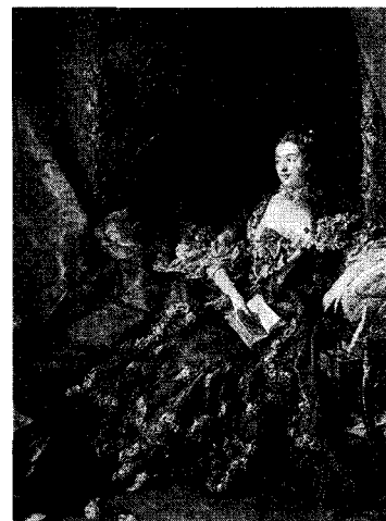
<그림 6> 살롱에서의 여성복식의 모습 정홍숙, 「서양복식문화사」, p.246.