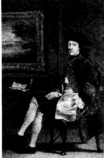
<그림 11> 화려한 자수 장식의 쥐스또코르 정홍숙, 『서양복식문화사』, p.256.