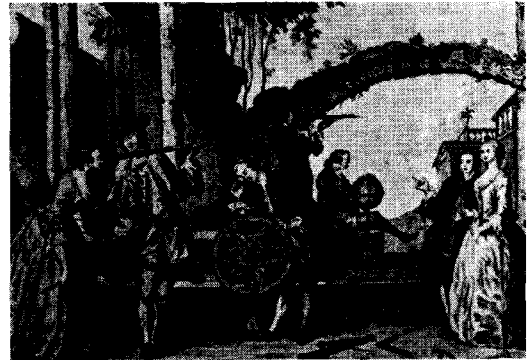
<그림 4> 과학에 관심을 보였던 18세기 남녀들 「계몽시대-Age of Enlightenment」, p.21.

여러 살롱 가운데 멘 후작 부인의 살롱에서는 주로 정치 문제를 논했다. 랑베르 후작 부인의 살롱에서는 화요일마다 몽테스키외, 마리보, 라 모트 등 문학가들 외에 귀족, 여성 문필가, 여배우 등의 다양한 계층의 사람들에게 개방되었다. 랑베르의 관심은 특히 사회에서의 여성의 지위에 쏠려있어서 1727년에는 ‘여성에 관한 새로운 고찰’이라는 글을 썼다. 그녀의 여성 해방론은 이론에만 머물지 않고 살롱은 통해 표출되었으며 다른 살롱 여성들이 그녀의 정신적 유산을 이어받았다. 51)