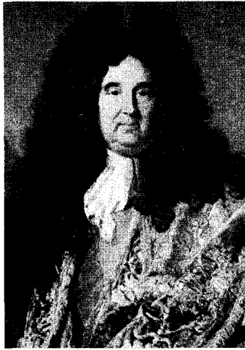
<그림 8> 긴머리 가발을 쓴 남성의 모습 『A History of Extraordinary Hair』