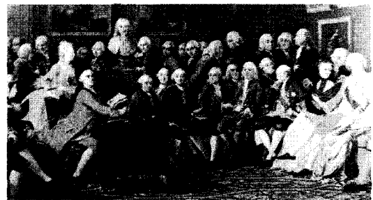
<그림 1> '조프랭 부인 저택에서의 저녁', 남녀가 함께 어울렸던 살롱의 모습

따라서 살롱은 문화적 자유 공간이자, 지성의 여성 지대로서 변화된 의식과 변화해 가는 의식의 출발점이었다. 16)