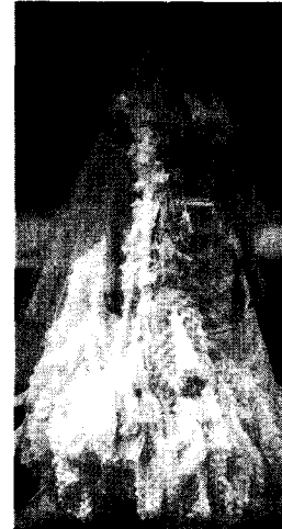
<그림 17> Christian Lacroix 2000 S/S Collection