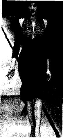
<그림 1> Jean Paul Gaultier 2002 S/S Collection