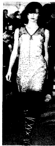
<그림 3> Halmut Lang 1996 S/S Collection