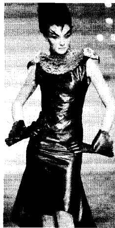
<그림 14> Givenchy 1998 F/W Collection

신화나 악마 또는 자연 생물체의 형상을 직접적으로 패션에 연결시켜서, 이성과 의지를 표방하는 인간의 모습이 아니라 비합리적인 방식으로 한계 상황을 이끌어 가는 인간의 퇴폐성을 표현하고 있는데, 이는 원시미술에서 행해지던 주술적이며 상징적인 의미를 통해 초월적인 힘이나 존재에 대해 신념을 두는 경우와 그 맥락을 같이 한다. <그림 14>에서는 새의 형상을 부분적으로 도입한 것으로, 몸통 부분은 얽고 스커트는 뒤가 더 길고 아래로 갈수록 퍼져 새의 꼬리부분을 연상케 하는 검정 가죽원피스에 넥라인을 깃털로 두른 후 양어깨에 새의 머리부분을 위치시키고, 눈 화장과 헤어스타일 역시 새의 두상과 흡사하게 변형시킨 모습을