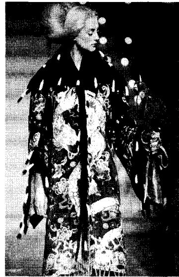
<그림 19> Givenchy 1998 F/W Collection

또한 Christian Lacroix는 시대나 민속의 질충적인 융합을 작업방식으로 하는 대표적인 디자이너로, <그림 20> 의 2002년 S/S 컬렉션은 아프리카 문양의 텍스타일을 페치워크한 상의와 역시 아프리카 문양을 세퀸으로 자수한 흰색 스커트의 투피스에 고급실크 망사와 레이스 소재를 사용하고 비드 장식을 더한 터번을 하여, 섬세하게 수 작업한 극도의 기교와 장식성을 보여주고 있다.