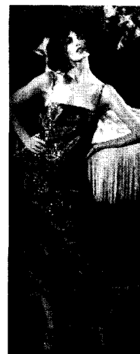
<그림 4> Christian Dior 1998 F/W Collection

또, 속옷은 비밀스런 의복 아이템으로 항상 겉옷에 숨겨져 있어서 속옷을 입는다는 것은 옷을 입은 것일 수도 벗은 것일 수도 있는 것으로 해석될 수 있다. 이런 속옷의 형태가 디자인에 응용되어 속옷 같은 겉옷, 겉옷 위에 입은 속옷 등 속옷을 겉옷화 하는 현상은 노출을 연상케 하는 방법으로 1990년대에 급속히 받아들여져, 속치마, 브레이저, 코르셋 등의 아이템과 레이스, 새틴, 쉬폰 등의 소재들이 컬렉션에 등장하는 것을 볼 수 있다.<그림 3> 19세기초 독일 상류 사회의 데카당스한 생활의 장면을 그린 표현주의 화가 Auto Dicks의 그림에서 영감을 받은 Christian Dior의 1998년 가을/겨울 컬렉션은 그 대표적인 예로 들 수 있겠는데, 슬립 형태의 이브닝 드레스에 아르데코 스타일의 보석들로 치장된 모델들을 밤거리에 옮겨 놓은 듯한 무대 위를 배회하게 하여 그것을 표현하였다.<그림 4>