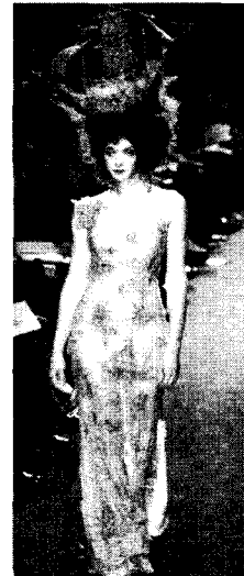
<그림 11> Jean Paul Gaultier 1998 F/W Collection