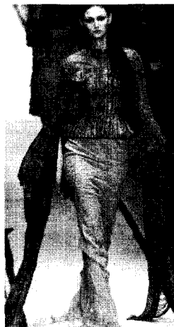
<그림 9> Jean Paul Gaultier 2002 F/W Collection