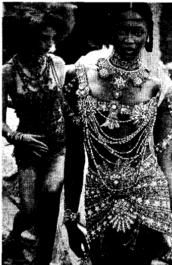
<그림 18> Christian Dior 1998 S/S Collection