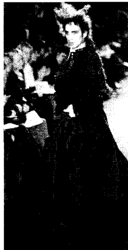
<그림 5> Jean Paul Gaultier 1998 F/W Collection

일부 하위문화 집단에 국한된 현상이 아니라 더 이상 무시할 수 없는 주된 사회 문화적 현상으로 자리잡는 시기에 이른 것을 말해주듯 복장도착 행위는 동성애적 성향의 컬렉션으로 활발히 발표되고 있다. 여성적 성도착 성향을 표현하기 위해 남성은 가슴과 허리, 엉덩이를 강조하거나 축소하는 X자형 실루엣으로 감성, 인내, 부드러움을 대표하는 여성이미지를 사용한다. 특히 장식적 패션을 입거나 특정한 이성의 아이템을 착용함으로써 남성을 가진 완벽한 여성성을 표현하고자 하는데, 여성의 드레스, 장갑, 목걸이, 반지, 팔찌, 브로치, 스카프, 코르사지, 부채, 깃털 등 여성이 사용하는 요소들을 사용한다. Jean Paul Gaultier는 1998년 가을/겨울 컬렉션에서 남성모델에게 가볍고 바삭거리는 느낌의 광택이 나는 새틴 소재로 된 풍성한 X자형 실루엣 드레스를 입혔는데, 러플을 장식하여 부드러움을 한층 더하였고, 긴 웨이브의 헤어스타일과 여성스런 메이크업을 하여 여성이미지를 연출하였다.<그림 5>