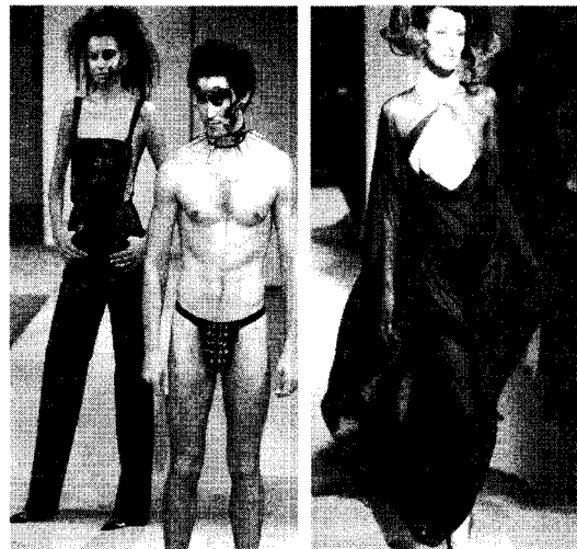
<그림 6> Abraham 2001 S/S Collection

성적 쾌락을 추구하는 극단적 형태로 가학 피학적 변태성욕(Sadomasochism)과 관련된 특정한 형태의 의상이나 물건들을 패션에 도입하는 것도 볼 수 있다.<그림 6, 7> 패션은 페티시즘을 표현하기 위한 편리한 항목이다. 가죽이나 고무의 소재를 사용하고 콜셋, 하이힐, 바디 피어싱, 오픈 스파이크 마스크 등의 아이템을 착용함으로써 사회가 감추고 부정했던 것에 정면으로 도전하고 대중적이면서 노골적인 패션을 창조, 성과 힘에 기초한 패션을 추구한 것이다. 14)