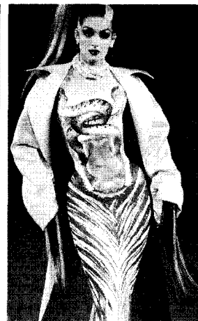
<그림 15> Thierry Mugler 1998 F/W Collection