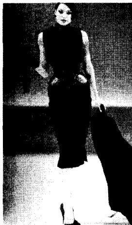
<그림 8> Thierry Mugler 1999 F/W Collection

비정상적이고, 괴상하고, 우스꽝스러우며, 기이한 형태의 패션 이미지들인 그로테스크는 정도가 지나쳐 정상 상태를 벗어난 극단적인 상태를 보여 소외되고 낯선 것에 대한 두려움을 형성한다. 또 추와 미, 무서움과 웃음, 호감과 혐오감 등 양립 불가능한 성질의 것을 공존시켜 그 충돌로부터 오는 부조화를 통해 양면적인 이상성을 표현하고 있다.<그림 10> 이런 이질성은 때로 일반적 규칙을 이탈하는데서 오는 풍자와 유희를 일으켜 작품의 획일화된 부분들을 비판하고 기존질서의 위선이나 횡포에 대해 반발하여 새롭고 창조적인 패션이미지를 연출하는데, 인체변형, 화장, 마스크, 과도한 가발<그림 11> 등으로 완전한 양면의 이미지를 구축한다. 17)