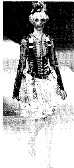
<그림 20> Christian Dior 2002 S/S Collection

퇴폐개념의 특징에 따른 패션이미지의 특성과 조형방법을 종합, 정리하면 <표 2> 와 같다.