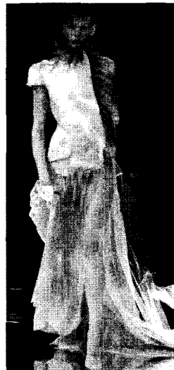
<그림 10> Seredin & Vasiliev 2001 F/W Collection