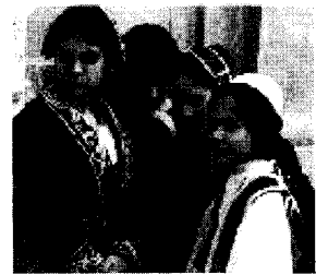
<그림 1> 이탈리아 남부 민속의상