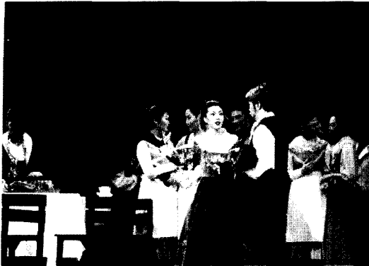
<그림 14> 무대효과 II