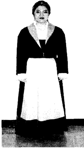
<그림 12> 루치아 실물의상