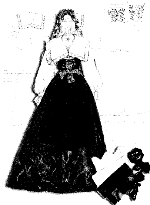
<그림 3> 산투자 의상디자인

소매 끝 부분에 레이스 장식을 하였다. 베스트와 스커트는 면 벨벳을 사용하였으며 베스트 앞판에 심플한 트리밍과 스커트 단 부분에도 공단 띠 2단을 두르고 가장자리에 선 장식을 하였다. 전체적으로 로라에 비해 장식 디테일을 자세하여 침울한 분위기를 만들어내고자 하였다. 또한 민속의상에 긴 거를 둔 에이프런을 하나의 장식 아이템으로 사용하여 전체적으로 활동적인 이미지를 부각하고자 하였다.<그림 3>