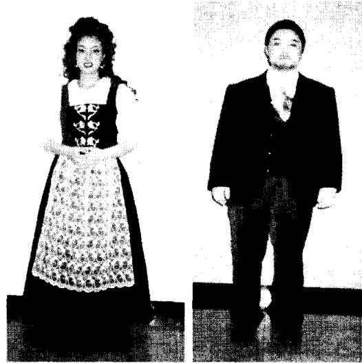
<그림 8> 산투자 실물의상 <그림 9> 투리두 실물의상

이상과 같이 제작의 과정에서 충분한 사전 조사와 등장인물과 연출가와의 의견 교환을 통해 미적인 측면은 물론 기능적이고 실용적인 측면을 충족시키는 의상을 제작 완성하였다. <그림 8-12>