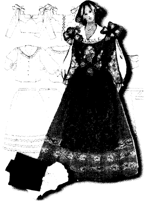
<그림 5> 로라 의상디자인

로라의 의상은 마을의 유지인 알피오의 아내이면서 옛 애인과 다시 사랑에 빠지는 갈등의 중심에 서는 인물로 의상을 통해 강한 인상을 주게 하였다. 옐로우 계열의 면 벨벳을 베스트와 스커트에 사용하여 고급스럽고 여성스러운 이미지를 전달하였으며 의복 아이템은 산투자와 동일하게 하면서 전체적으로 화려한 디테일 장식을 사용하여 정열적인 이미지를 부각시켰다. 베스트와 스커트 단 부분에 식물무늬와 꽃무늬 비즈 장식과 장식 슬리브, 어깨리본 장식, 허리리본 장식, 모자, 장식용 에이프런을 통해 사랑스러우면서도 허영심이 있는 파시적인 모습을 나타내었다. <그림 5>