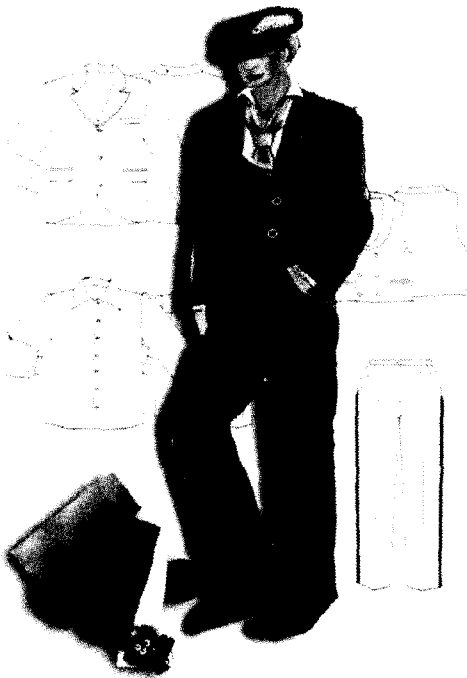
<그림 4> 투리두 의상디자인

을 응용해 시대적 느낌을 살렸다. 또한 베스트와 재킷의 경우 블루 계열의 면 벨벳을 사용하고 거기에 넥타이를 코디네이션 시킴으로써 전체적으로 감성적이며 로맨틱한 이미지를 전달하고자 하였다. <그림 4>