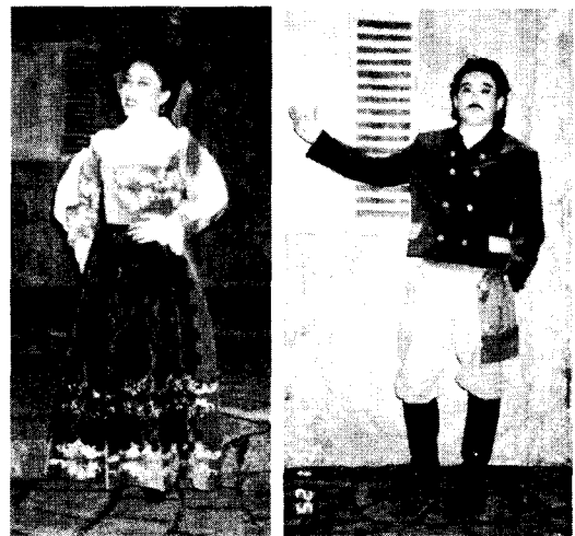
<그림 10> 로라 실물의상 <그림 11> 알피오 실물의상