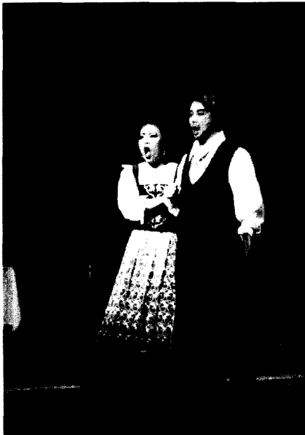
<그림 15> 무대효과 III