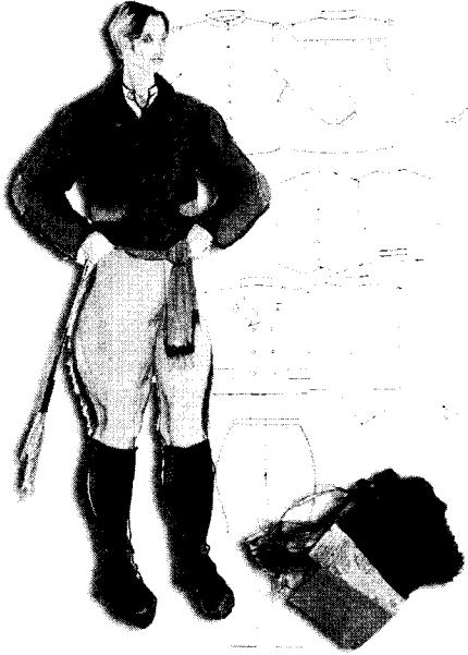
<그림 6> 알피오 의상디자인

공단을 사용하여 전체적으로 수수하면서도 변화가 있는 디자인을 제시하였다.<그림 7>