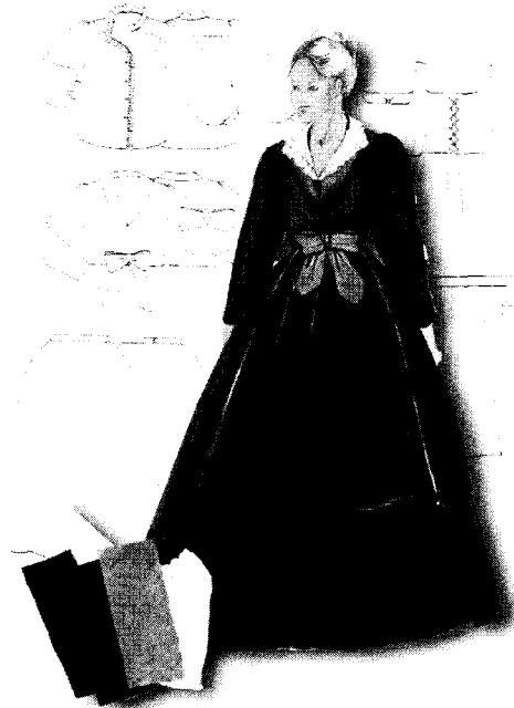
<그림 7> 루치아 의상디자인