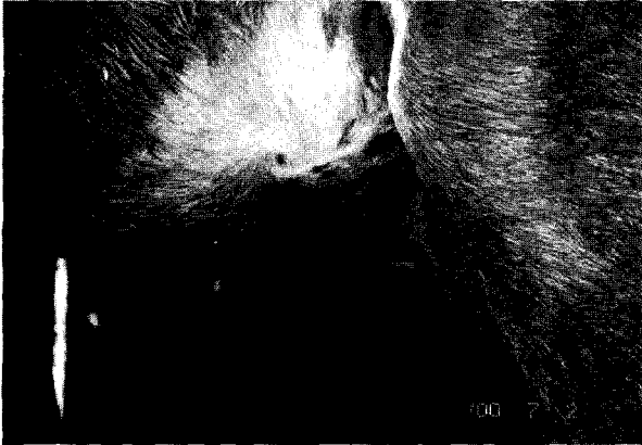
Fig 6. Skin defect healed in about 15 days through contraction and epithelialization.