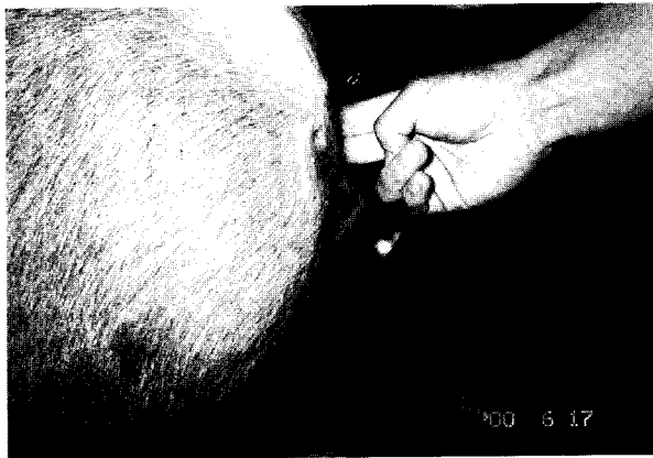
Fig 2. Small umbilical hernia(2-3 fingers) are non-painful and reducible.