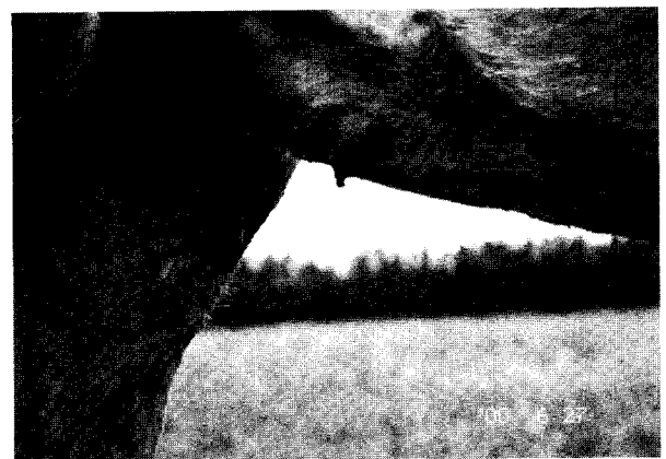
Fig 5. The exposed hernia sac became ischemic necrosis and detached in about 10 days.

낭은 점차 괴사되었고, 약 10일이 경과되자 조직에 삽입되었던 안전핀이 고무링과 함께 탈락되었으며(Fig 5), 15일이 지나 주변 조직의 수축과 상피화로 상흔이 형성되면서 치유되었다(Fig 6).