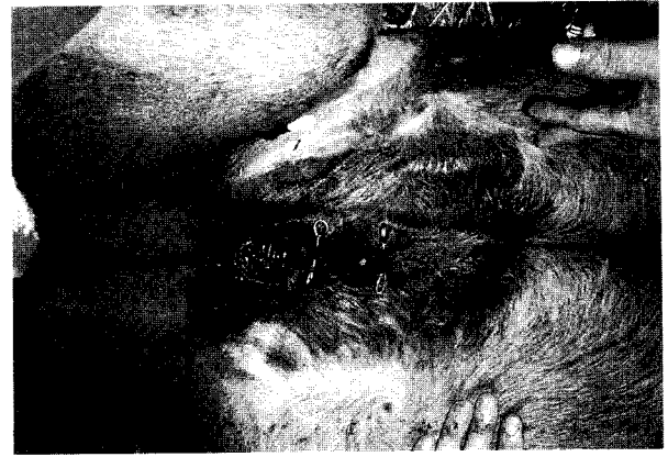
Fig 3. Two pins made by a wire were pricked at edges of hernia ring.