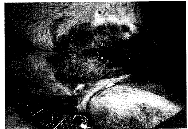
Fig 4. Hernia sac and skin were tightened by rubber rings.