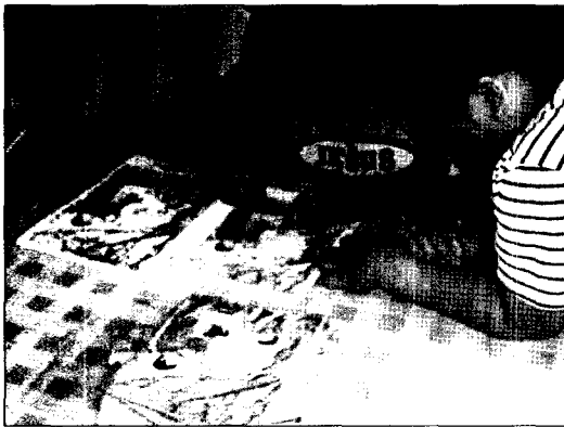
〈그림 3〉 제3단계의 퍼즐작업