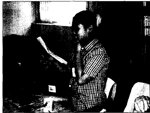
〈그림 4〉 제4단계의 어머니께 편지 전하기