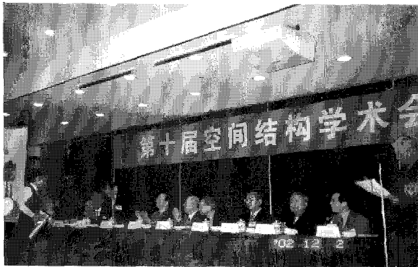
〈그림 1〉 귀빈 개개인 소개