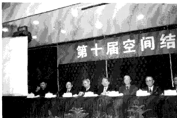
〈그림 2〉 귀빈석에 좌정