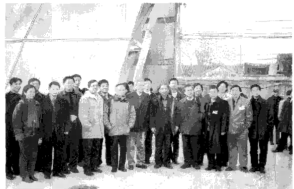
〈그림 4〉 기술참관 중 중국국가대극장 공사현장 앞에서 참석자 일동