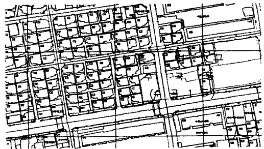
그림 1 GPS-RTK를 이용한 도시시설물 취득파일 (예)