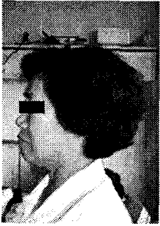
Figure 2. The lateral side of the face