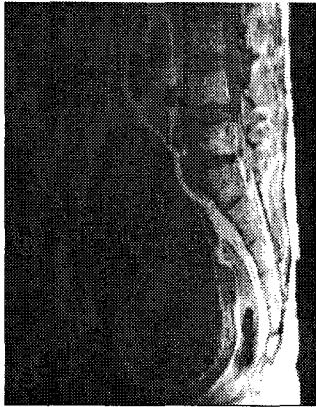
Figure 5. Neurogenic bladder