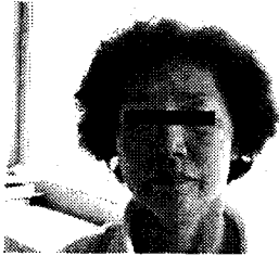
Figure 1. The front side of the face

(Figure 1~3. 은 치료 기간 중 자립 및 자력 보행이 가능한 상태에서 촬영하였다.)