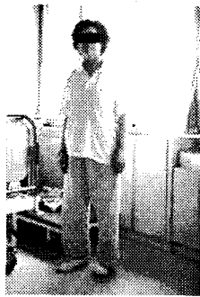
Figure 3. The front side of the whole body