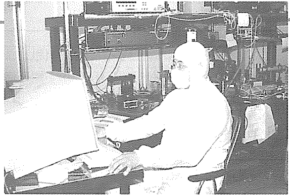
▲광소자 연구개발팀은 박사급 연구진을 포함, 탄탄한 노하우를 바탕으로 경쟁력 있는 제품 개발에 최선을 다하고 있다.

PPI가 고부가가치 산업으로 각광받는 광통신 분야에서 두각을 나타내는 것은 회사 대표의 경험과 연구인력의 우