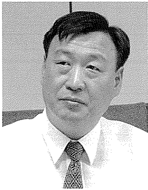
이희범 / 산업자원부 차관